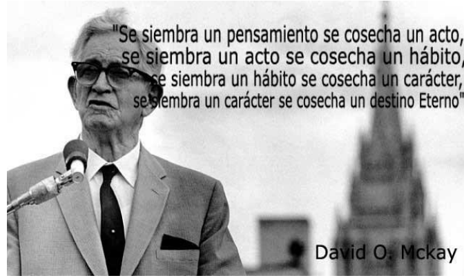
David O. McKay